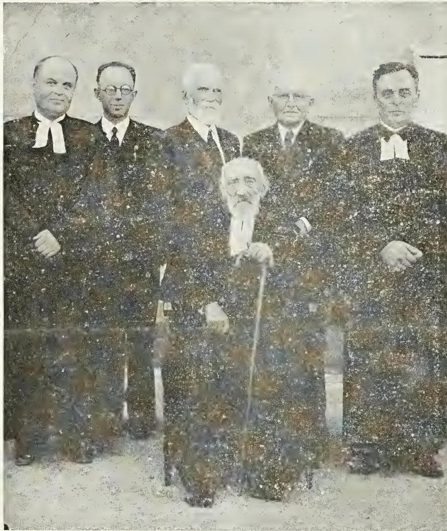
Los Pastores Valdenses presentes al acto.

Para nuestro Decano — que acompañamos con el deseo de nuevos años de vida bendecida — no hubo medalla en el ejército del mundo; habrá "corona de la vida" que Dios da al siervo bueno y fiel!